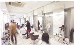
↑Happiness 2大寺店の店内。ヘアスタイリングの設備、ネイルスペースを完備

年間支払額に応じてロイヤルゲストを3段階に区別（準ロイヤル…10～12万/ロイヤル…12～18万/スーパーロイヤル…18万以上）。誕生日にはメッセージ付きのお花、クリスマスケーキ、おせちのプレゼントなどのサービス